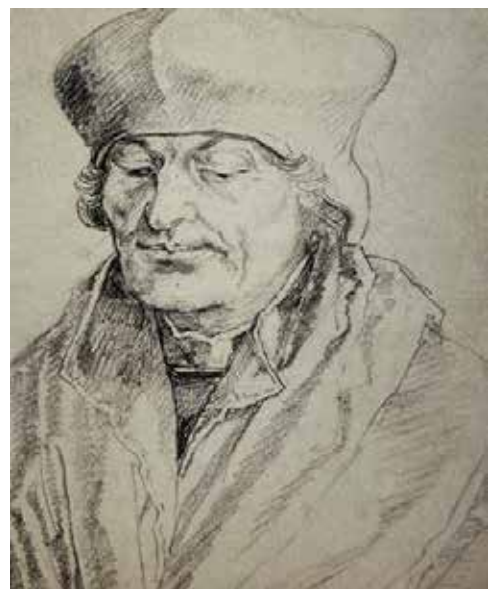
Desiderius Erasmus – schets (1520) van Albrecht Dürer (1471-1528)