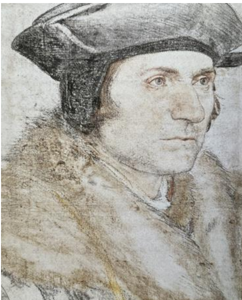
Thomas More – tekening (1527) van Hans Holbein der Jüngere (1497/1498–1543)

Maar is Utopia ('geen plaats' van het Griekse οὐ τόπος) echt een Eutopia ('goede plaats' van het Griekse εὖ τόπος)? Is het goed toeven in Utopia of is het inderdaad beter het niet te bezoeken? Erasmus noemt in zijn colloquium Diversoria ('Herbergen', 1523) 5 Plato's staat als een model voor een gebrek aan persoonlijke vrijheid doordat iedereen daar gelijk behandeld wordt. Toch laat More zijn reiziger uit Utopia onder meer vertellen: sunt enim hanc in partem aliquanto procliviores, ut nullum voluptatis genus (ex quo nihil sequatur in-