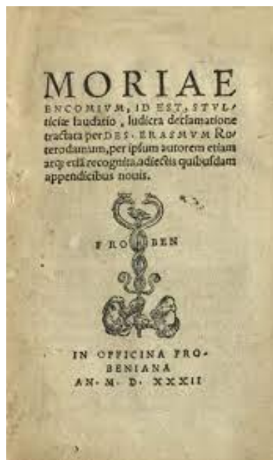
Titelblad van een Latijnse uitgave van Moriae Encomium (Lof der zotheid) van Erasmus Froben in Bazel, 1532